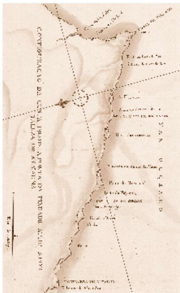
ANTT, CF 211, f. 24V: Configuração da costa desde a Ponta da Piedade até à Fortaleza de Almadena.