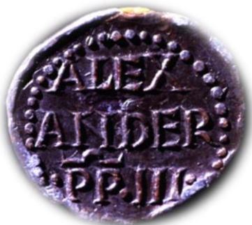
Selo do Papa Alexandre III, idêntico ao original que autenticava a Bula

A bula Manifestis Probatum de 23 de Maio de 1179 é um dos tesouros da Torre do Tombo.